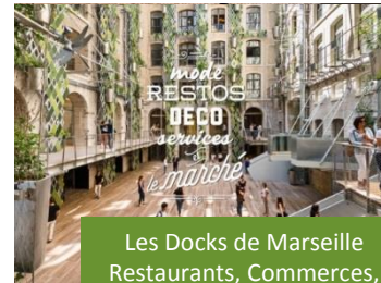
Les Docks de Marseille Restaurants, Commerces, Bureaux