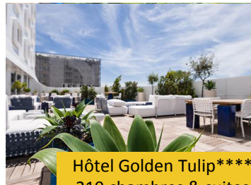
Hôtel Golden Tulip**** 210 chambres & suites