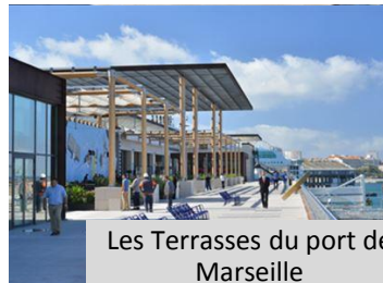
Les Terrasses du port de Marseille Restaurants et Commerces