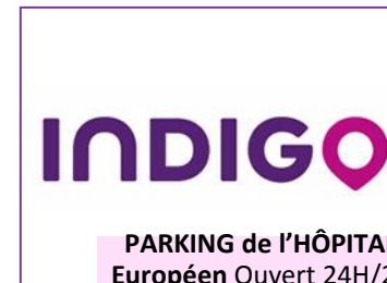
PARKING de l'HÔPITAL Européen Ouvert 24H/24 et 7J/7