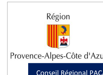
Région Provence-Alpes-Côte d'Azur Conseil Régional PACA